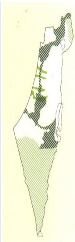
שימור שטחים פתוחים בשדרה המרכזית ובערצני הנחלים