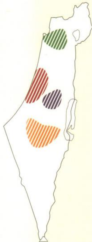
פיתוח מרחבים מעויירים בארבעה מטרופולינים