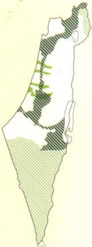
שימור שטחים פתוחים בשדרה המרכזית ובערוצי הנחלים

• העקרונות המרכזיים: ייעול השימוש בקרקע, תוך חיזוק העירוניות, הגדלת הצפיפות וצמצום פיתוח פרברי ובזבזני בקרקע, שמירת השחים הפתוחים.