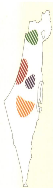
פיתוח מרחבים מעוירים בארבעה מטרופולינים

פיתוח מוטה תחבורה ציבורית ומערכות הסעת המונים – על מנת לאפשר לתושבים נגישות למוקדי תעסוקה, לשירותים ולבילוי, העיר צריכה לאפשר מבחר של אמצעי תחבורה זמינים ונוחים, ובכלל זה תחבורה ציבורית, מסלולי הליכה ברגל ונתיבי אופניים.