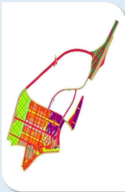
תמ"ל 1006 אשקלון מתחם מ-7